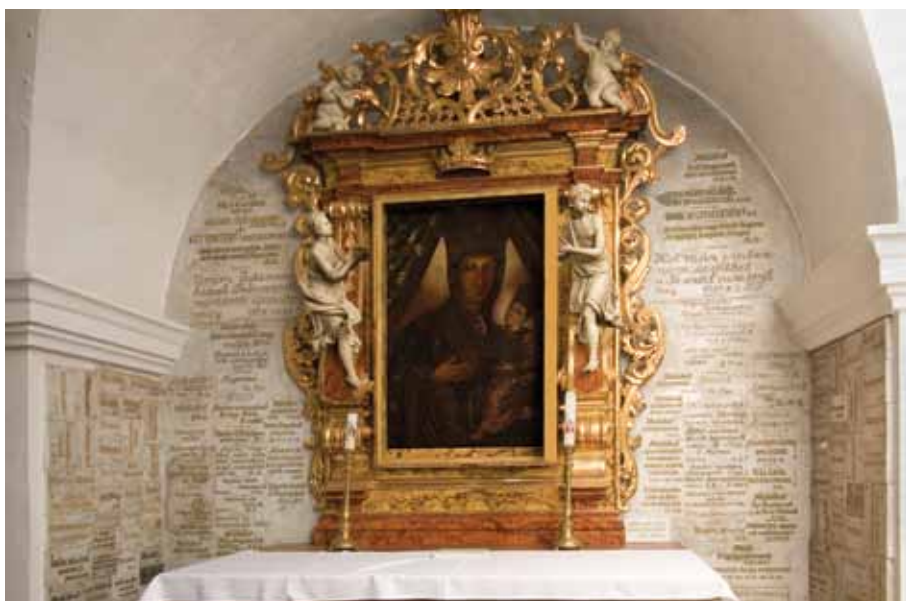
Az oltár a kegyképpel

Máriának is nevezett Szűzanya tisztelete. A török hódoltság miatt a 16–17. században a pálos rend helyzete Magyarországon meggyengült, ekkor tagjaik között egyre több horvát és lengyel tűnt föl, ezért a częstochowai Szűz Mária tisztelete erősödött. De az 1683-ban meginduló, török elleni felszabadító háború virágoztatja fel igazán ezt a kultuszt. Ennek a hadjáratnak a vezető személyisége Sobieski János lengyel király volt, aki magával hozta a csodatévő tulajdonsággal bíró częstochowai kegykép másolatát. Naponta misét mondott előtte, a sorra bekövetkező győzelmeket neki tulajdonították.