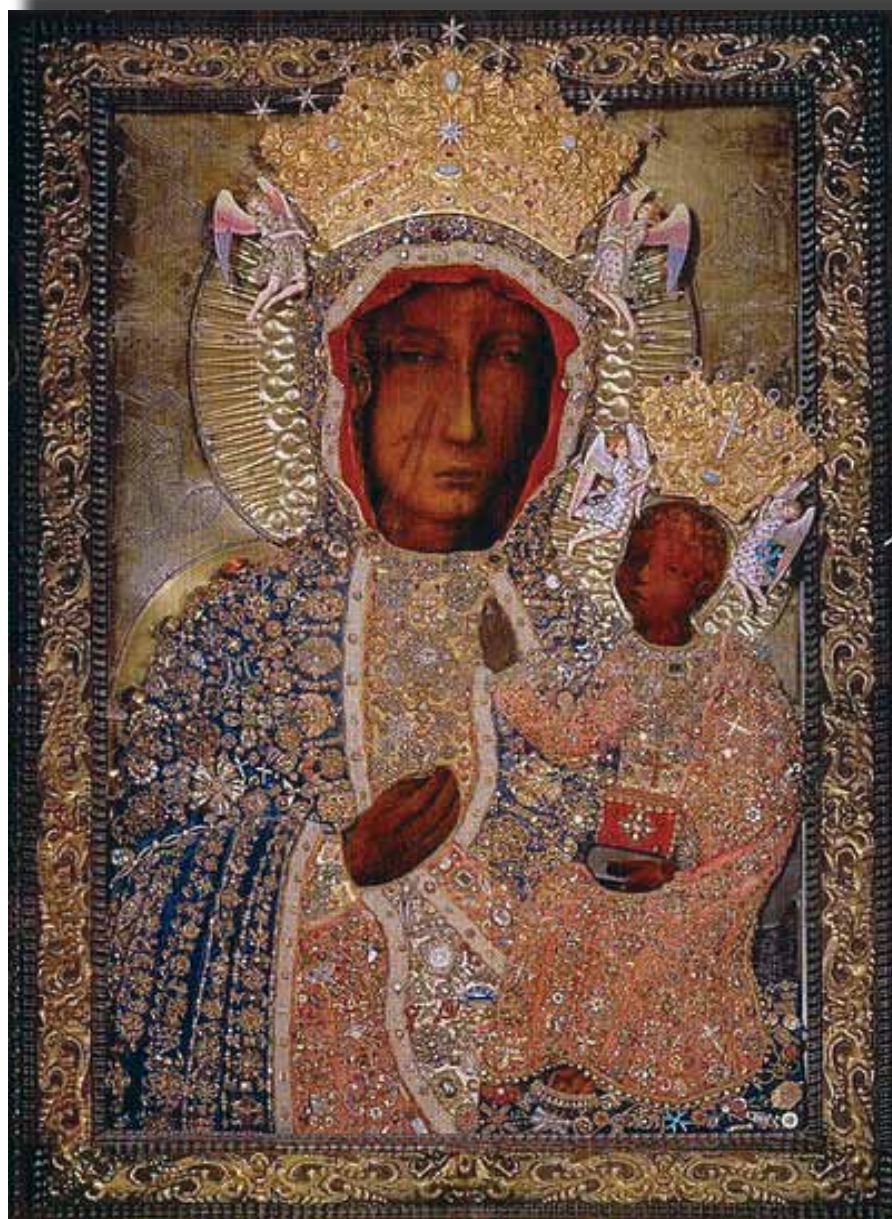
Czarna Madonna w złotej koronie i szatach

O bok przedstawionych tu dwu najbardziej popularnych schematów kompozycyjnych istnieją oczywiście również inne, rozpowszechnione w sztuce, np. typy „Galaktotrofuśa” – Matka Boska karmiąca czy „Pieta” – Maria trzymająca na kolanach ciało