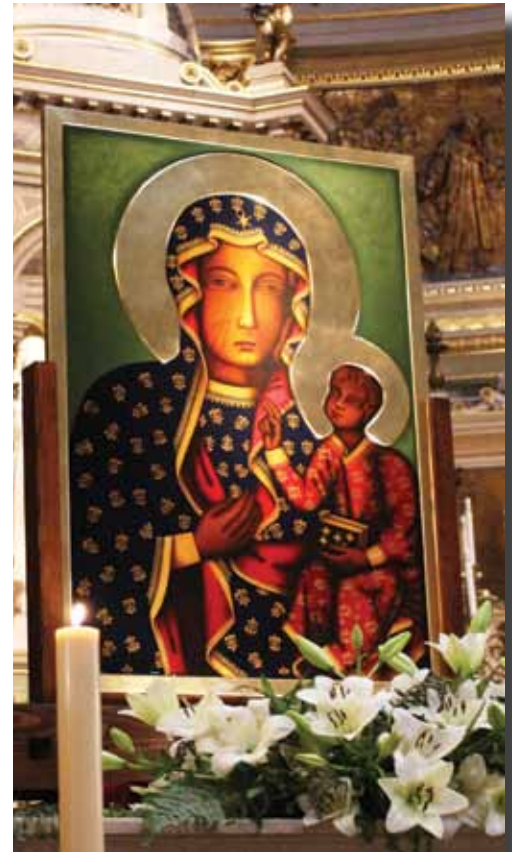
Czarna Madonna w Bazylice św. Stefana

26 maja w Dniu Matki i 26 sierpnia w święto Matki Bożej Częstochowskiej. Tak będzie również i w tym roku.