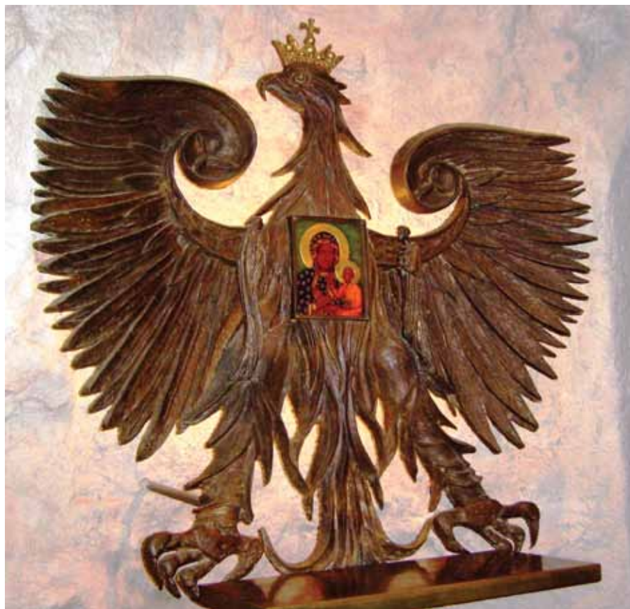
Czarna Madonna w Kościele Skalnym