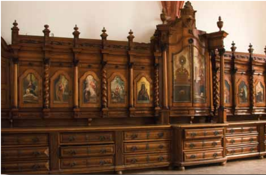
A sekrestye szekrénySORA

A szegedit, ismereteink szerint, 1740-ben készítette fatáblára a szegedi Morvay András. Ez a festmény az eredetihez képest igen díszes. Szilárdfy Zoltán elmondja, hogy Morvay András a Felvidékről, Trencsénből érkezett, és a szegedi Városi Tanácsnak a tagja volt. Egy évvel a elkészülte után, 1741-ben halt meg, és itt, az alsóvárosi templom kriptájában temették el. Ő mutat rá arra is, hogy a pálosok mellett a ferencesek templomaiban láthatjuk leggyakrabban a Fekete Mária-kép másolatait. A kegyképről ír Nátyi Róbert is, szerinte a szegedi kép az eredetihez csak távolról, ikonográfiai típusában hasonlít, Morvay a háttérbe egy baldachint festett. Nátyi megjegyzi, hogy a festő nyilván valamilyen korabeli metszet alapján dolgozott.