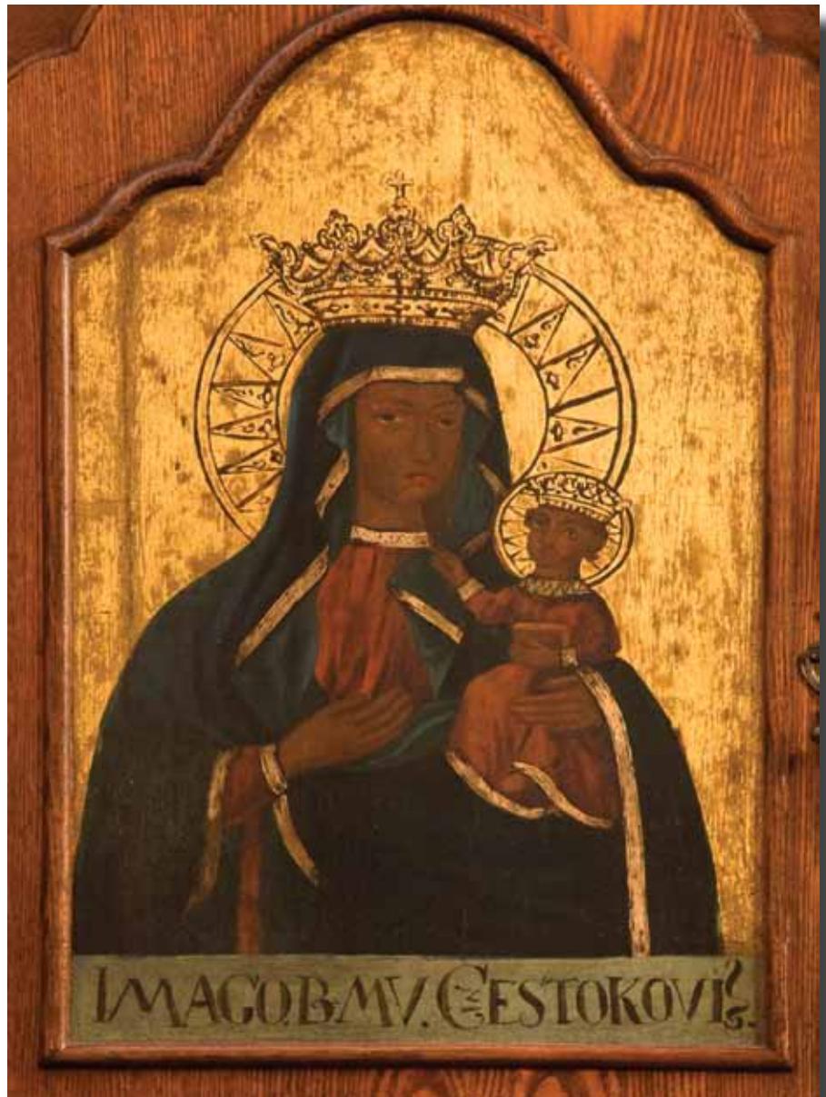
A Fekete Mária kép

A templom a 20. század elejére igen rossz állapotba került. Felújítását Páter Zadravetz István kezdi meg 1914-ben. Miután ő 1920-ban elkerült Budapestre, tekintélyével és nemegyszer anyagi segítségével az 1930-as években is folytatódott a templom felújítása. A ferences rend saját szakemberei a ha-