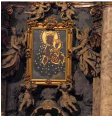
Czarna Madonna w Kościele Śródmiejskim