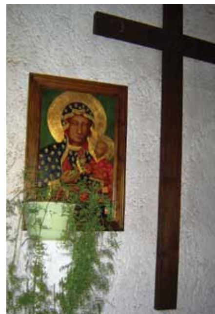
Czarna Madonna w Balatonboglár

W 1950 roku władze komunistyczne zamieniły klasztor na internat szkoły baletowej, a kościół na magazyn. Zniszczeniu uległy wszystkie ołtarze, paramenty i obrazy, w tym również obraz Matki Bożej Jasno-